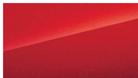
Parkour Red (5.000,-)