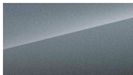
Climbing Grey (5.000,-)