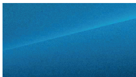
Surfing Blue (5.000,-)